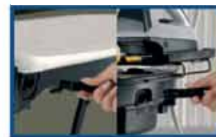
Löstagbar nätsladd och urtagbar kontakt till ångstrykjärnet.