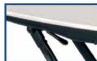
Sju nivålägen med fjäderlås.